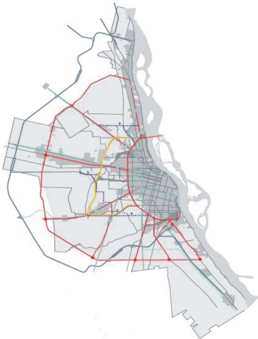
Gráfico 2. Plan Urbano Rosario. Fuente: Municipalidad de Rosario (2008) Plan Urbano Rosario 2007- 2017.

El Plan Urbano es la principal figura del planeamiento en la que se define el proyecto de ciudad y de ordenamiento integral del territorio municipal, entendiendo a la ciudad como una totalidad. En el se indican las directrices generales de ordenamiento, los proyectos de carácter estructural para su transformación y los procedimientos que orientan la gestión municipal. Es un instrumento básico y necesario, dado que no requiere de una figura previa y su elaboración es imprescindible para la definición de otros instrumentos que contribuyen a la ejecución de las políticas urbanísticas (Plan Urbano Rosario 2007 – 2017, 2008).