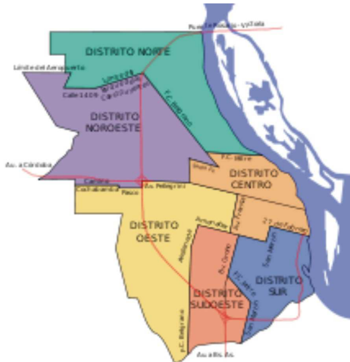
Gráfico 3. Planes de Distritos Municipales.

a) Plan de Distrito especifica los contenidos de la transformación urbanística para cada uno de los distritos. Los contenidos se refieren específicamente a: operaciones estructurales, proyectos programados (sistema de espacios públicos, la red vial, la red de infraestructuras de servicios, la dotación de equipamientos y la vivienda social), protección urbanística y ambiental de sitios y programas de equipamientos básicos.