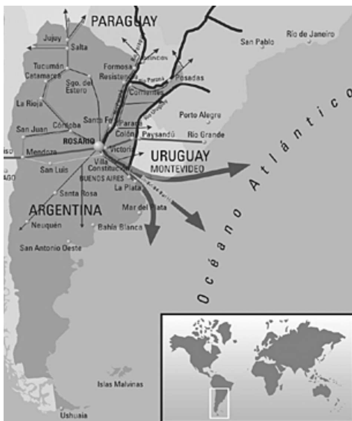
Gráfico 1. Ubicación de la ciudad de Rosario en América Latina.

En ese contexto, la organización territorial de la provincia de Santa Fe, también atraviesa una profunda etapa de transformación. En la ciudad de Rosario y otras localidades que forman su área metropolitana (Gran Rosario), con 1.161.188 habitantes (INDEC, 2001) es donde más se evidencia el cambio. La pertenencia y ubicación privilegiada de la urbe frente al esquema regional ampliado, ligado a la creación de un mercado común (MERCOSUR), la convierten en un centro de esperado despegue económico y factible crecimiento poblacional. La inserción territorial y metropolitana, fortalece su rol como centro productivo, comercial, de servicios y comunicaciones a escala ampliada. También como foco educativo, cultural, deportivo y turístico.