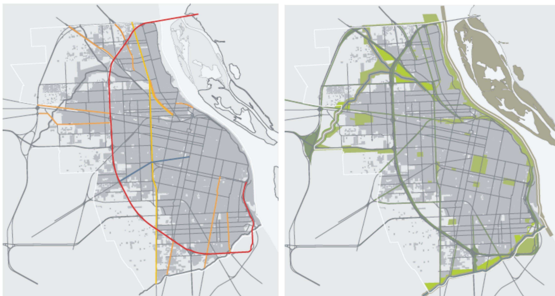
Gráfico 6. Planes Sectoriales de Movilidad y Ambiental Fuente: Municipalidad de Rosario (2008) Plan Urbano Rosario 2007- 2017.